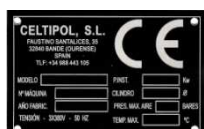
Fabricado en España